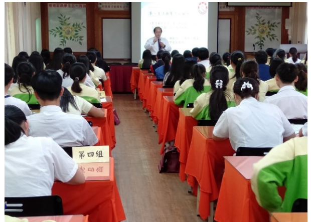
※教授講解認真且讓同學有講義可做筆記