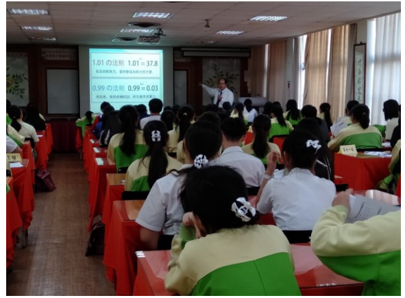
※教授說明成功的法則