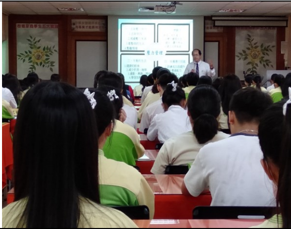
※教授說明壓力管理的策略