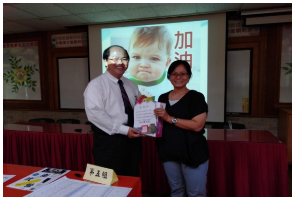
※輔導組長頒發感謝狀