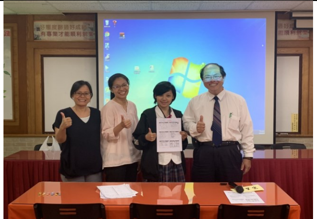
※同學課後回饋與合影