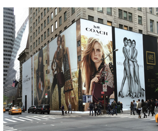
紐約第五大道名店林立。