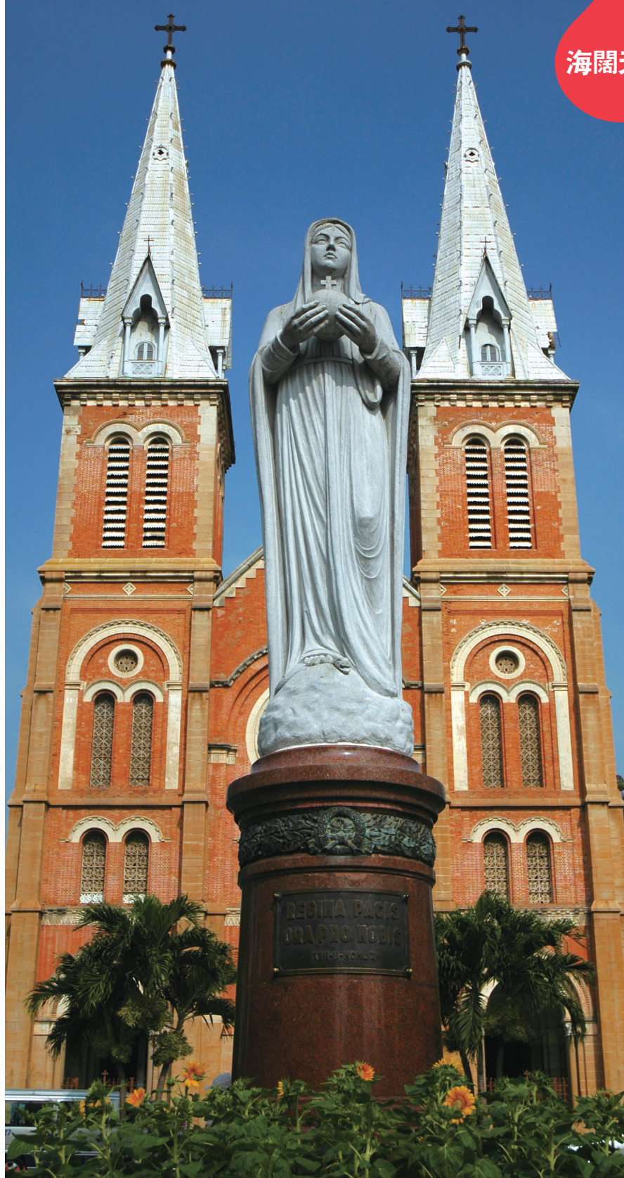
越南胡志明市的西貢紅教堂。

從藝術品的瀏覽、近距離的觀察到親身的互動，我真實地凝視、感受越南女性點滴變幻的身影；同時，在遇見她們的過程中，我也和逝去的親人及佛菩薩有了重新連接，並確信這層連結和關係是篤定的、可以延續的，讓這趟豐富的異國文化之旅畫下圓滿的句點。 (作者為南華大學國際事務與企業學系教授)