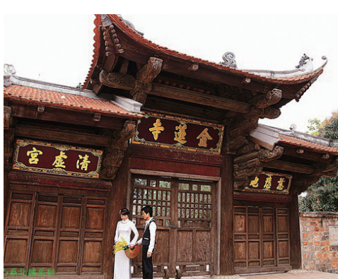
胡志明市的金蓮寺。