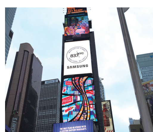
紐約地標之一的時代廣場。

洛克菲勒中心是歷史上最浩大的都市計畫之一！它是座落於美國紐約第五大道的一個由數個摩天大樓組成的城中城，一九三九年由洛克斐勒家族出資建造，由十九棟大樓組成，各大樓底層相通。涵蓋第五大道至第七大道，介於四十七街至五十二街之間，區內涵括餐廳、辦公大樓、服飾店、銀行、郵局、書店……甚至還有地下鐵道貫穿連結。 建築師聰明地利用大樓間的廣場、空地與樓梯間製造行人流動的方向，讓一天超過二十五萬的人潮在此穿梭無虞。對於公共空間的運用開啓了城市規畫的新風貌，完整的商場與辦公大樓讓中城區繼華爾街之後，成為紐約第二個市中心。一九八七年被美國政府認定為國家歷史地標。 終於走到百聞不如一見的「時代廣場」。電影《美國隊長》、《蜘蛛人》、《曼哈頓情緣》、《金剛》……等數不清有多少電影在這裡取景，尤其每年跨年倒數，更能集聚來自世界各地近百萬人來到這裡朝聖，聽導遊說，跨年當天，中午就封街管制進入，因為動彈不得，每個人都要包尿片解決內急痛苦。電影《101次新年快樂》演的就是跨年蘋果倒落的幕後情景，很寫實的傳達時代廣場跨年倒數的浪漫情節。 時代廣場是美國紐約曼哈頓的一個商業中心，位於百老匯大道與第七大道會合處，範圍由西四十二街延伸至西四十七街。時代廣場的名稱源自《紐約時報》早期在此設立之總部大樓，因此中文譯名有時會根據報社而譯為「時報廣場」，或根據英文原名「Times」直譯為「時代廣場」，又被稱作「世界的十字路口」，是世界上行人來往最密集的步行地段之一，和世界娛樂產業的中心之一。 《金玉盟》、《北京遇上西雅圖》、《西雅圖夜未眠》、《金剛》外，這些借景帝國大廈的電影，都是講述男女主角相約約定，卻因陰錯陽差錯過然後又重逢，劇情賺人熱淚也讓帝國大廈成了詮釋完美愛情的表徵。 紐約塞車盛況也是一絕，差點讓我們趕不上登樓時間。踏進帝國大廈根本沒有時間參觀大廳的內部設施，趕緊排隊等候電梯，先搭第一段快速電梯到八十樓，從電梯出來後又要排隊等候，再轉搭另一部電梯才能登上八十六樓觀景台。一整天細雨不斷當然也影響我們登頂觀賞，整個曼哈頓區全被雨霧遮蔽，隱約可見的天際線呈現另一種朦朧美。 帝國大廈位於美國紐約州紐約市曼哈頓第五大道三五〇號、西三十三街與西三十四街之間的一棟摩天大樓。是紐約市以至美國最著名的地標和旅遊景點之一，為美國及美洲第四高，世界上第二十五高的摩天大樓，也是保持世界最高建築地位最久的摩天大樓（一九三一到一九七二年）。樓高三八一公尺、一〇三層，於一九五一年增添的天線高六十二公尺，提高其總高度至四四三公尺，為裝飾藝術風格建築，大樓於一九三〇年動工，於一九三一年落成，建造過程僅四一〇日，是世界上罕見的建造速度紀錄。 (本系列結束)