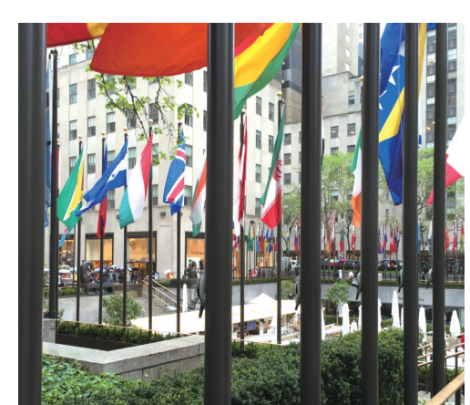
洛克斐勒中心開啓城市新風貌。